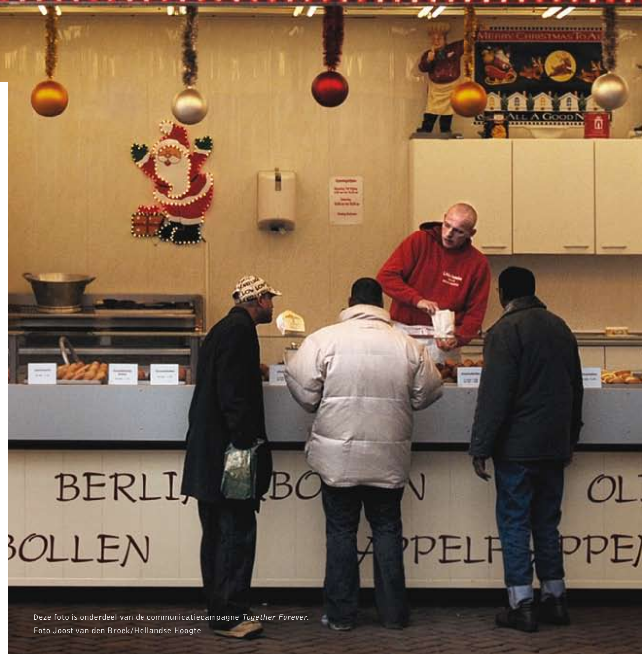
Deze foto is onderdeel van de communicatiecampagne Together Forever .

De Europese Commissie financiert een aantal zogenaamde vlaggenschipprojecten op Europese schaal. Na een open oproep ontving de commissie meer dan driehonderd projectvoorstellen, waarvan er zeven zijn geselecteerd. Hiermee is een budget van 2,4 miljoen euro gemoeid. Twee van de zeven projecten vinden ook in Nederland plaats. Kijk voor meer informatie op pagina 14 en 15.