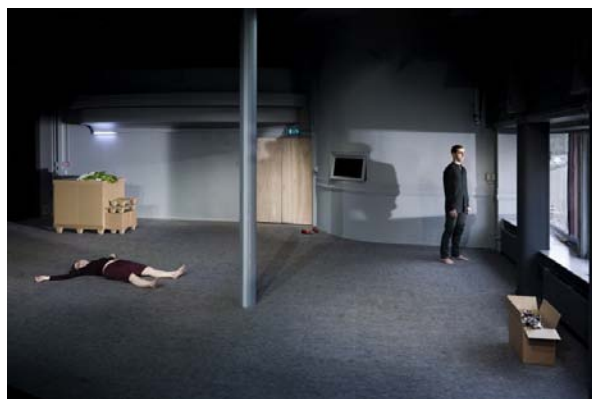
Suze May Sho