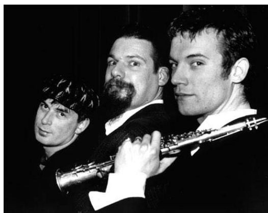
De Jongens Driest